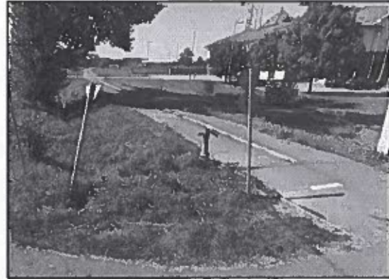
Köz kifolyó a Széchenyi utcában