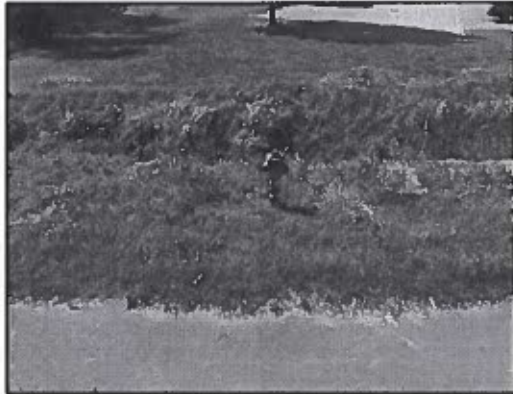
Tűzcsap a Széchenyi és Nyársas utca kereszteződésben